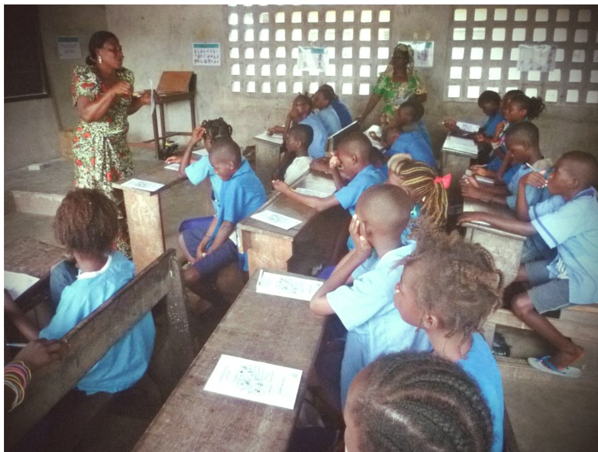
↳ Lancement des animations avec l'outil pédagogique de l'Ecole de la Paix à Pointe-Noire, Congo