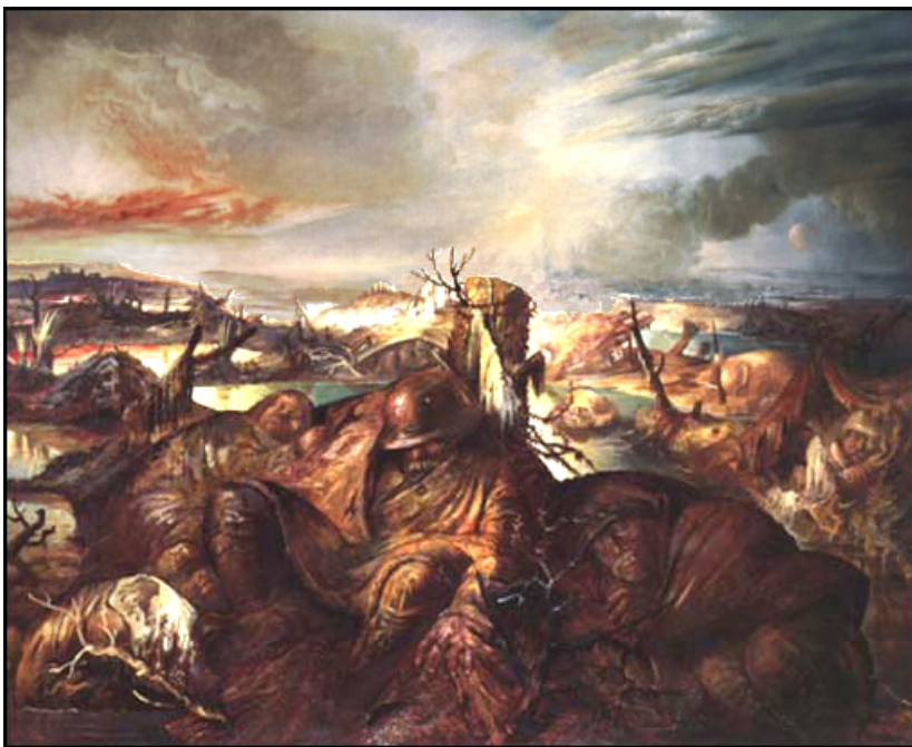
Flandern , Otto Dix (Flandres, 1934-1936) : ce paysage dantesque restitue l'univers décrit par Henri Barbusse dans Le Feu , roman de guerre autobiographique de 1916 qui décrit les conditions de vie dans les tranchées.

Chaque outil sera organisé sous forme de fiches facilement utilisables et fera des liens avec de nombreux sites internet. Et notamment celui de « l'abri mémoire », qui rassemble de nombreux éléments pédagogiques produits dans le cadre de l'outil « Histoire de Guerre, Parcours de Paix », fruit de la collaboration entre la Communauté de Communes de Cernay, Uffholtz, Steinbach et Wattwiller et l'Ecole de la paix en 2004.