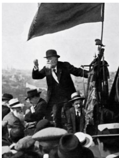
Jean Jaures, à la butte du Chapeau rouge, participant à une grande manifestation pacifiste (1914)